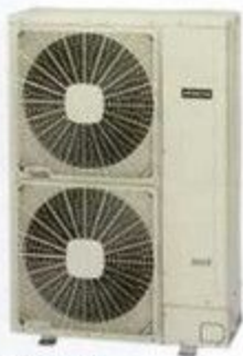
OUTDOOR UNIT 240 x 610 x 265 mm