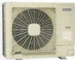
OUTDOOR UNIT RAD 24 HFSMWE-4F