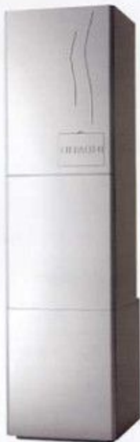
INDOOR UNIT 2000 x 420 x 1000 mm